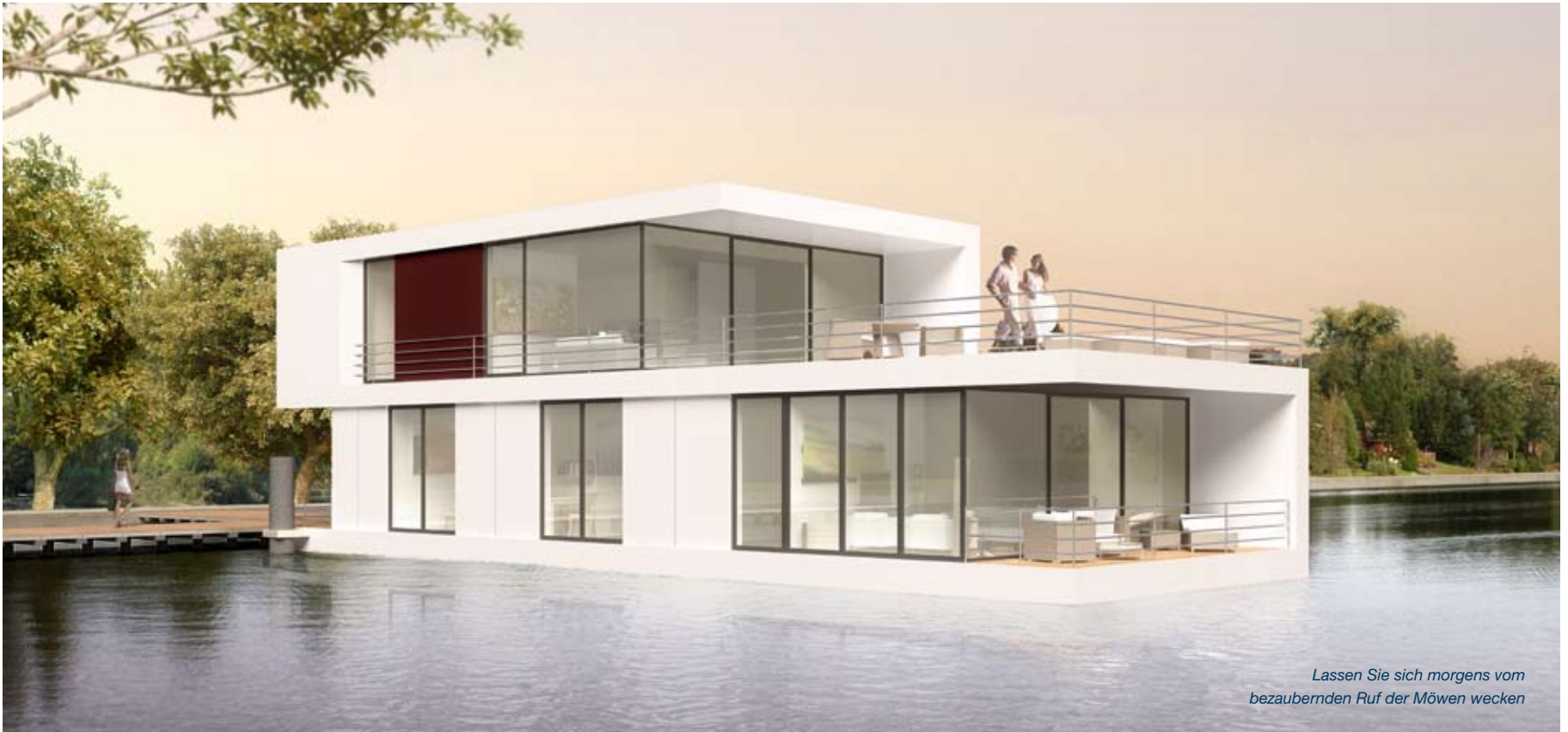
Lassen Sie sich morgens vom bezaubernden Ruf der Möwen wecken

Betrachter in Begeisterung. Zur Landseite hingegen zeigt sich das Hausboot eher verschlossen. So werden hier bewusst weniger Verglasungen angeboten, um sich den Blicken neugieriger Fußgänger, aber auch dem Straßenlärm besser entziehen zu können. Nur ein