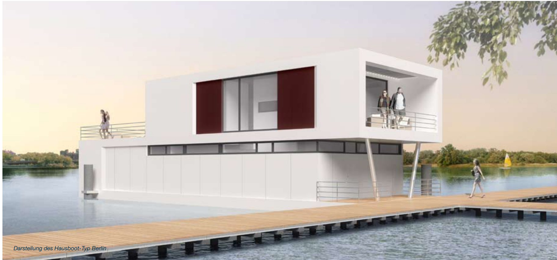
Darstellung des Hausboot-Typ Berlin